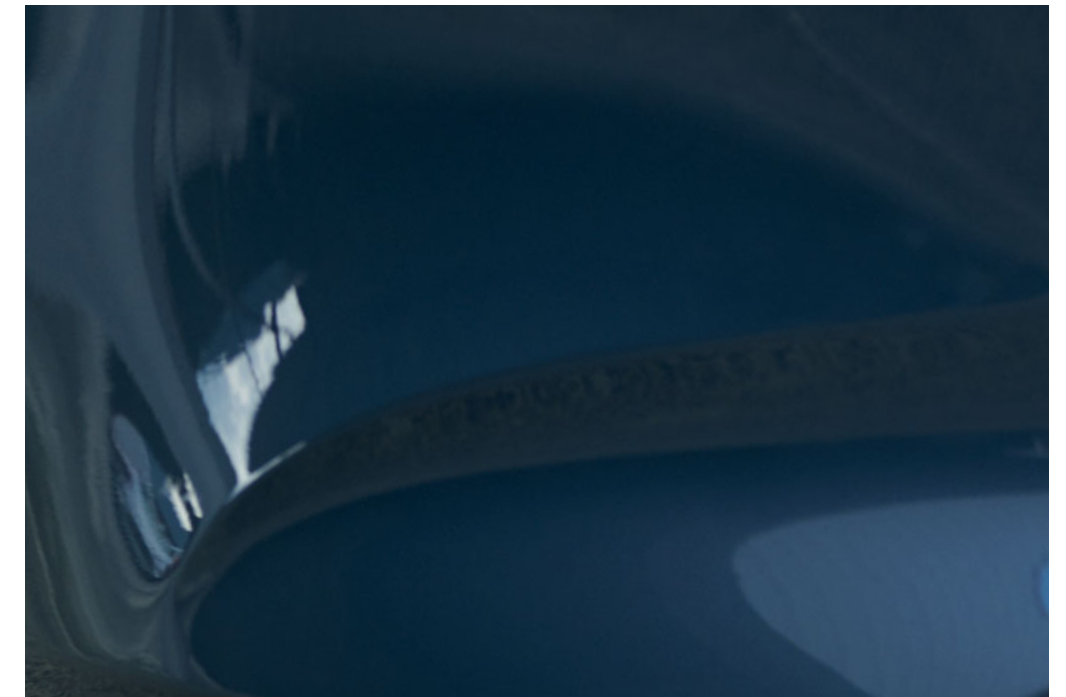
Polymetal Gray Metallic