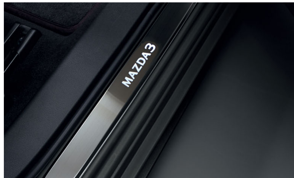
Osvětlené lišty prahů