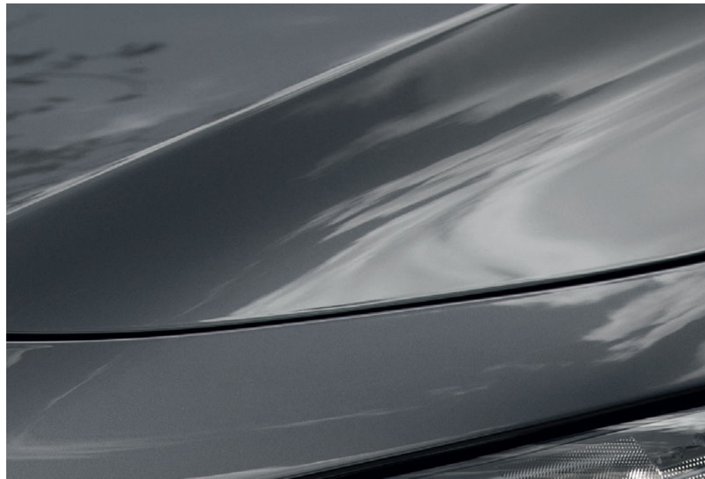
Šedá Machine Gray

Navštivte naše internetové stránky a prohlédněte si všechny dostupné úžasné barevné varianty.