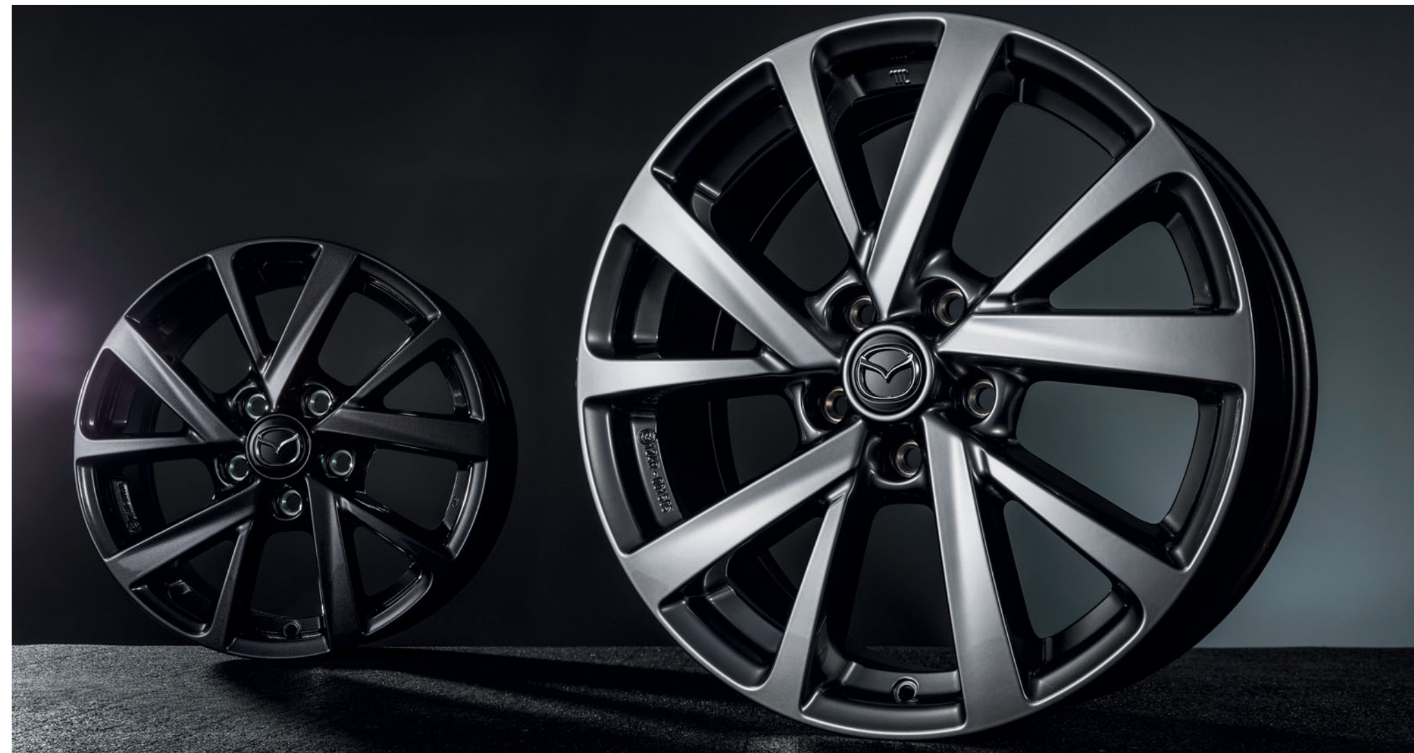
Hliníkové disky kol